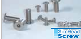
スリムヘッド・スクリュー