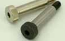
ショルダーボルト